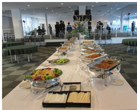
ホスピタリティラウンジ ピュッフェイメージ