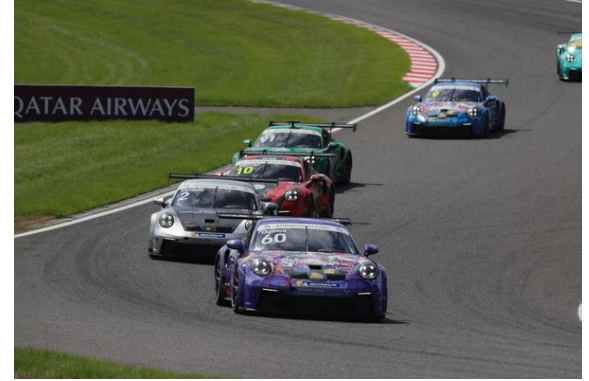
Porsche Carrera Cup