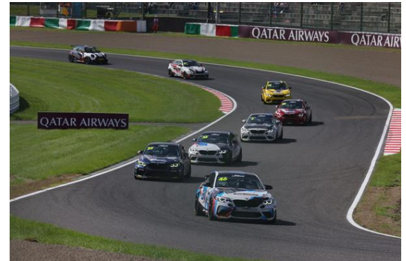
BMW & MINI Racing