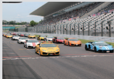
ピットウォーク時に国際レーシングコースでパレードを実施(11、12日)。