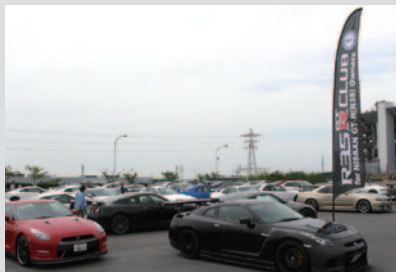
BNR32/BCNR33/BNR34/R35が展示されました(11日 GPスクエア)。

スーパー耐久の前身「N1耐久」時代から現在まで活躍するGT-Rの歴代車両が鈴鹿に集結。「レジェンド オブ R'sエンブレム GT-Rミーティング」が開催されました。