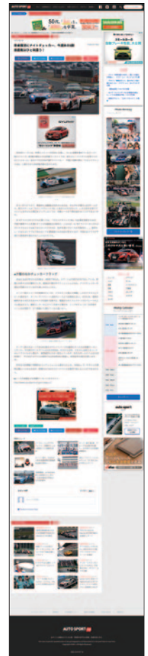
6月9日(木)・10日(金) AUTO SPORT WEB