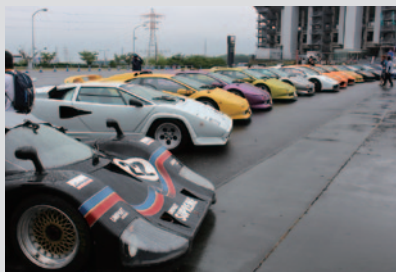
レーシングマシンから公道走行可能なスーパーカーまでランボルギーネが一堂に(12日 GPスクエア)。

LAMBORGHINI BLANCPAIN SUPER TROFEOの開催を記念して「ランボルギーネミーティング」が開催されました。