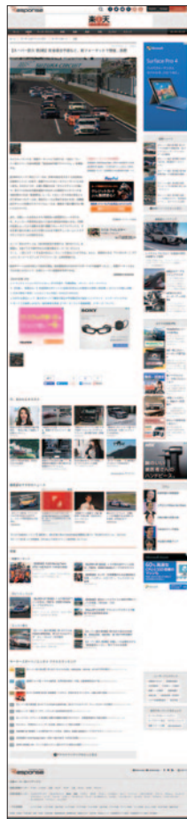
3月8日(火) レスポンス