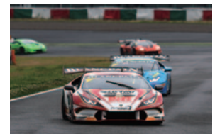
レース2 Afiq YAZID/落合 俊之