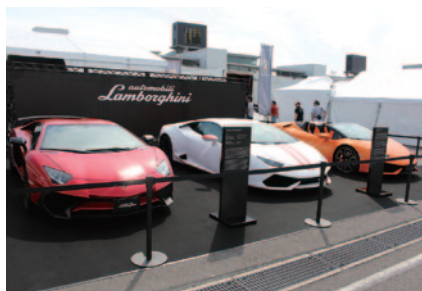
ランボルギーネトロフェオピットで行われたニューモデル展示(A/パドック)。