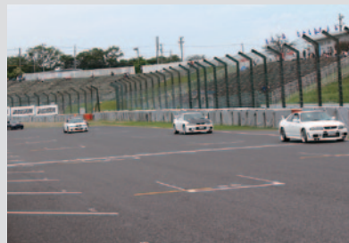
国際レーシングコースをパレード走行(11日)。