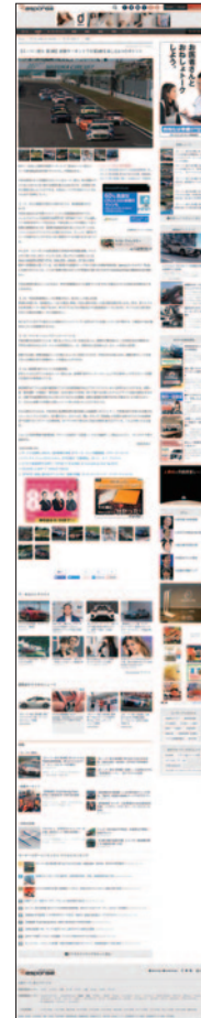
6月6日(月) レスポンス