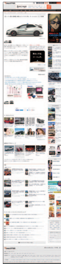
5月30日(月) レスポンス