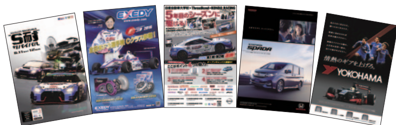
A4 カラー 44p 9,000部発行