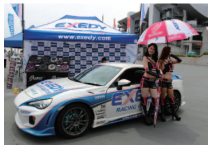
EXEDYブースで行われたEXEDY RACING GIRLS撮影会(GPスクエア)。