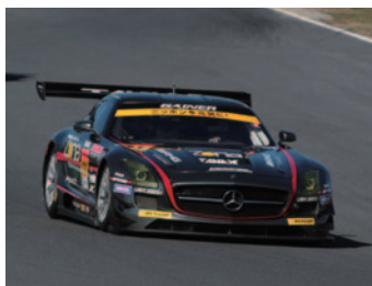
GT300クラス優勝 GAINER DIXCEL SLS