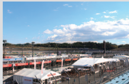
スーパースピードウェイに各メーカーブースやレストスペース、飲食ブースを集中設置した「ホスピタリティガーデン」。