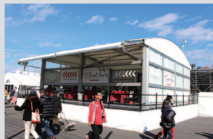
話題の出張料理人吉田友則氏がツインリンクもてぎ オフィシャルシェフをつとめたレストラン「Front Row」。