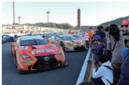
決勝レースを終えたマシンの保管場所「パークフェルメ」の間近までお入りいただいた「パークフェルメウォーク」。