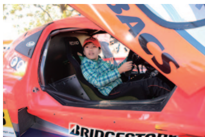
GT300マシン「ガライヤ」へのキッズ限定搭乗体験が行われたオートボックスブース。

国内屈指の人気を誇り、国際的にも注目されているSUPER GTシリーズ。今年もツインリンクもてぎでの最終戦にチャンピオン争いが持ち越されることとなり、さらに一新されたGT500クラスの走りなど話題満載の大会を各パートナー様のプロモーションイベントが華やかに彩りました。