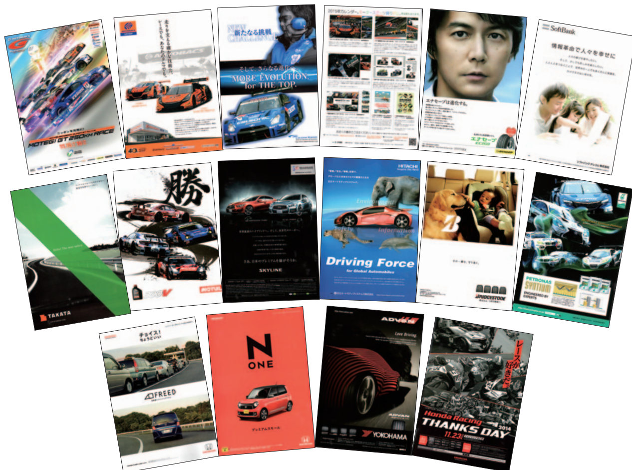
A4 カラー 86p 17,000部発行