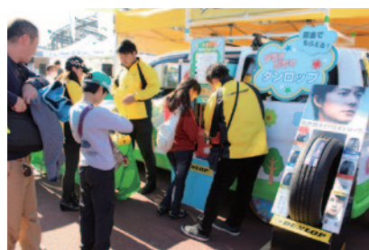
募金をすると「がちゃがちゃ」にトライでき、オリジナルグッズがプレゼントされたダンロップブース。