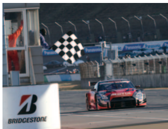
GT500クラス優勝 MOTUL AUTECH GT-R