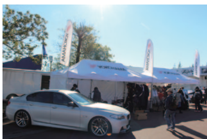
製品および装着車の展示が行われたヨコハマブース。