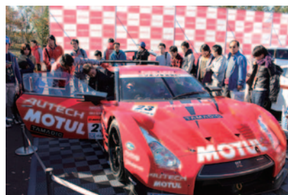
NISMOブースで行われた2013 GT500仕様GT-Rの cockpit体験。