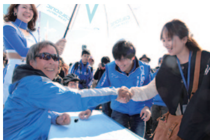
カルソニックブースで行われた星野一義監督のサイン会。