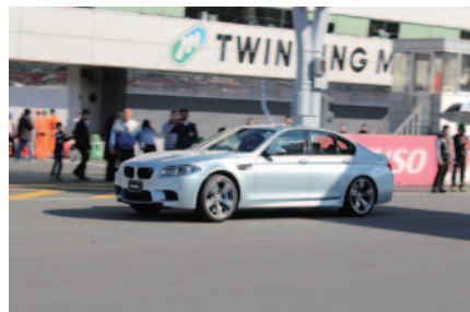
レーシングドライバーの運転するスポーティーカーでロードコースを体験走行いただいた「サーキットエクスペリエンス」。