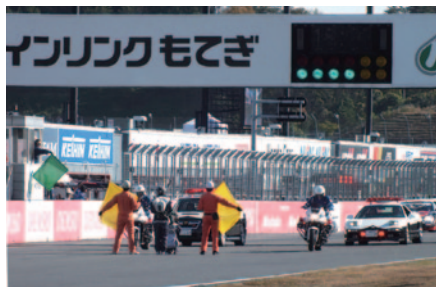
交通安全啓発活動の一環として栃木県警の白バイとパトカーが決勝スタート前のパレードラップを先導しました。