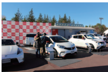
ニューモデルが展示された日産ブース。