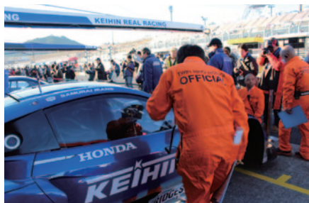
15日(土)朝にピットウォークスタイルで行われた公開車検「オープンピット」。