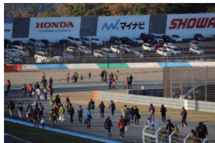
決勝レース終了後にロードコース(西コース)を歩いてご体験いただいた「コースウォーク」。