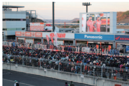
本大会の表彰、そしてシリーズ表彰のあとに全ドライバーが参加してファンに一年のお礼を伝えた「グランドフィナーレ」。