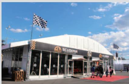
宇都宮の「SUNSET ROASTER COFFEE」の絶品コーヒーでゆったりくつろげる本格カフェ「GT CAFE SCUDERIA」。