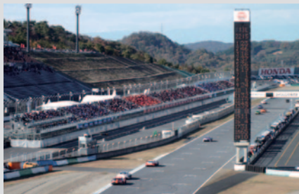
最終コーナーから見た「V席」(ロードコース左側スタンド)。

今回、ロードコースサイドに設けられたV席(ピクトリースタンド)。マシンの走りを間近に体感いただけるロケーションに加えて、スーパースピードウェイには各メーカーブースや飲食ブースが立ち並ぶ「ホスピタリティガーデン」を設置、臨場感あふれる快適な観戦環境をご提供しました。