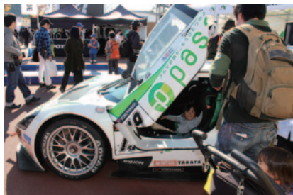
富士スピードウェイでシリーズ戦が行われているインタープロトシリーズ参戦マシン「KURUMA」の Cockpit体験が行われたネクセリア東日本ブース。