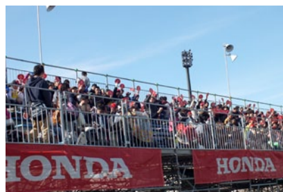
グランドスタンドV席に設置された「Hondaファンシート」。決勝前にはドライバー訪問も行われました。