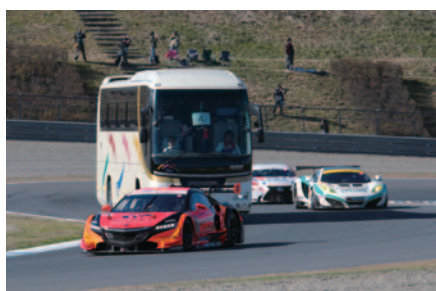
SUPER GTマシンが疾走するロードコースをバスで遊覧走行いただいた「サーキットサファリ」。