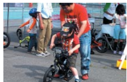
株式会社ジェイ・スポーツ