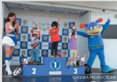
協力:ストライダージャパン 協賛:森永製菓株式会社