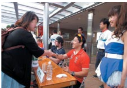
DAY 1表彰式終了後に行われたライダーサイン会