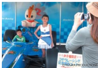
コチラレーシングブースではマシン搭乗に加え、ツインリンクもてぎエンジェルのコスチュームやレーシングスーツでのなりきり体験が人気を集めていました