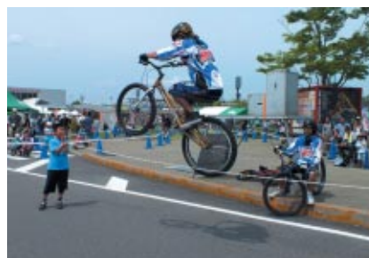
「ストライダーエンジョイカップ」会場で行われた自転車パフォーマンスユニット「K&D」によるスーパーテクニックのデモンストレーション