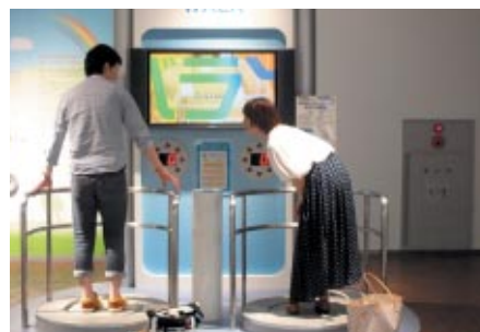
バランス感覚を競う「ASIMOのバランスゲーム」日本人トップライダーのスコアに挑戦していただきました(Honda Collection Hall)