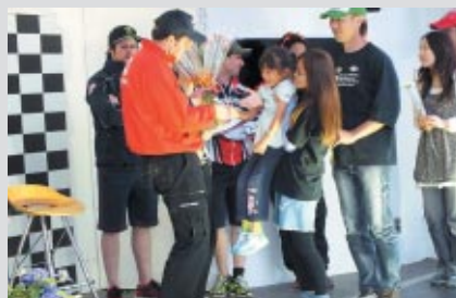
抽選で選ばれた50組のお客さまが花束を贈りました