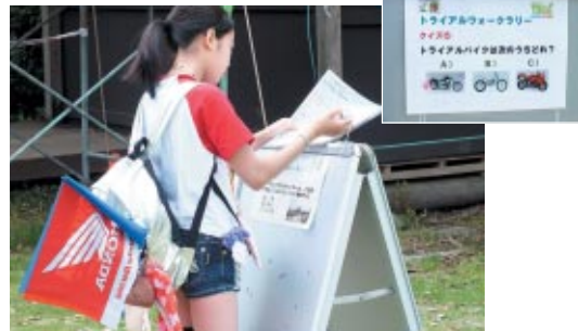
場内各所に設けられたクイズに答えながらスタンプを集めて藤波レプリカヘルメットや棚田米など豪華賞品が当たる「トライアルウォークラリー」