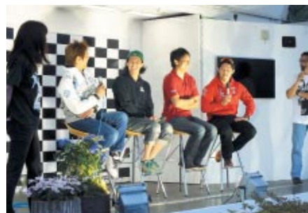
恒例の前夜祭「トライアルナイト」日本人トップライダーのトークショーやじゃんけん大会が開催されました