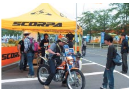
ヤマハエンジンを搭載するフランスのSCORPA製トライアル マシンの展示・搭乗体験が行われました