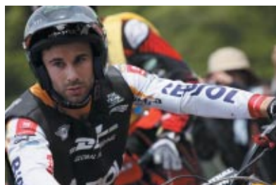
日本グランプリ完全制覇のトニー・ボウ