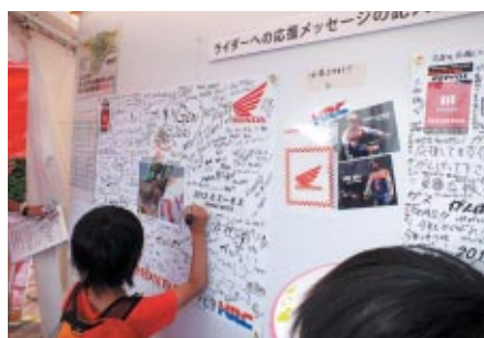
Hondaブースに設置されたライダーへの応援メッセージボード