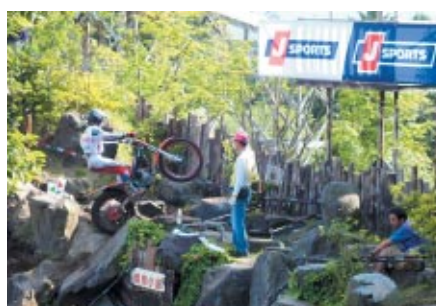
第1・13・14・15セクションに設置されたJ SPORTSパナー (写真:第14セクション)