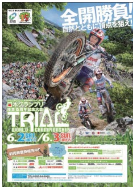
スペシャルチラシ