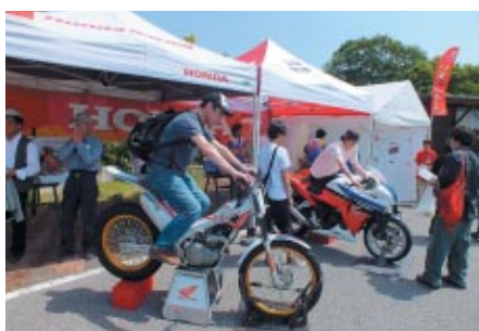
トライアルワークスマシンはもとより、NSF250などロードレーサー の展示・搭乗体験も行われたHondaブース