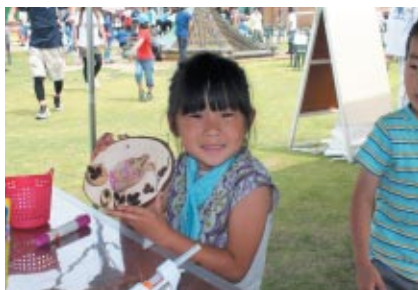
中央エントランスで行われたハローウッズの体験コーナー 森のクラフト体験(写真)やのこぎり体験、火おこし体験などをお楽しみいただきました