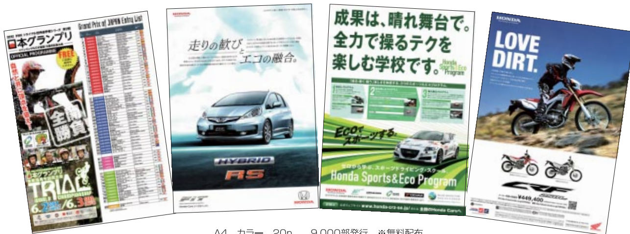
A4 カラー 20p 9,000部発行 ※無料配布