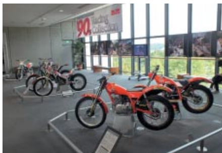
1990年代のトライアルマシンを中心とした特別展示「'90s Racing collection」(Honda Collection Hall)