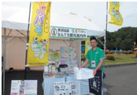
地元 那須塩原市の観光や物産をご紹介いただきました