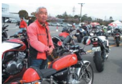
Honda ドリーム50で愛知県からお越しのお客さま 愛車でのサーキットクルージングが楽しみで鈴鹿には 年3~4回はいらっしゃるそうです