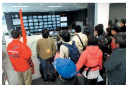
普段は入れないビットやメディアセンター、管制室(写真)をご案内した 「ビットガレージツアー」