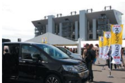
New STEP WGNの特別展示(写真)をはじめ、 各ジャンルのHonda製品が一堂に会しました