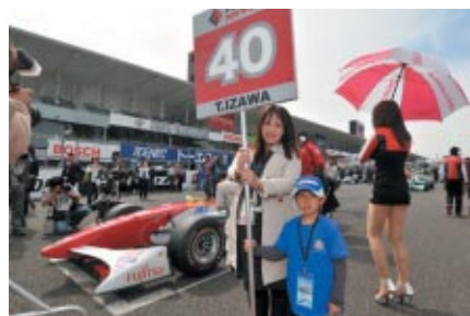
コチラちゃんファンクラブ、コチラレーシングクラブ会員の皆さんにフォーミュラ・ニッポンのグリッドキッズを務めていただきました