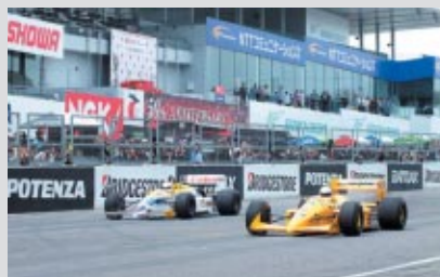
左からウィリアムズFW11(星野車)、ロータス100T(中嶋車)