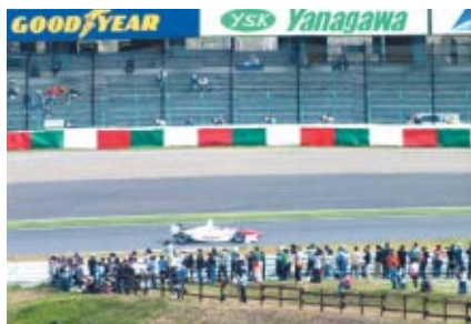
コース内3カ所に設けられた「激感エリア」(写真は2コーナーイン側) 各エリアをつなぐ無料シャトル「バドックシャトル@激感」も 運行されました