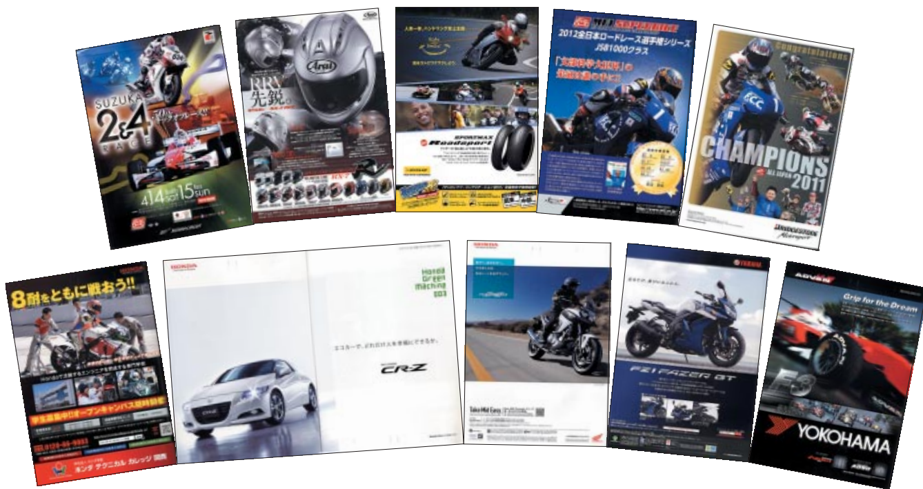
A4 カラー72p 9,000部発行

株式会社アライヘルメット 一般財団法人日本モーターサイクルスポーツ協会 株式会社ホンダモーターサイクルジャパン 株式会社アイデア 株式会社ブリヂストン ヤマハ発動機販売株式会社 株式会社三栄書房 学校法人ホンダ学園ホンダテクニカルカレッジ関西 横浜ゴム株式会社 住友ゴム工業株式会社 本田技研工業株式会社