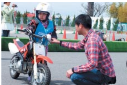
バイク体験を通じて親子のきずなを深めていただいた 「親子バイク体験」(会場:交通教育センター)