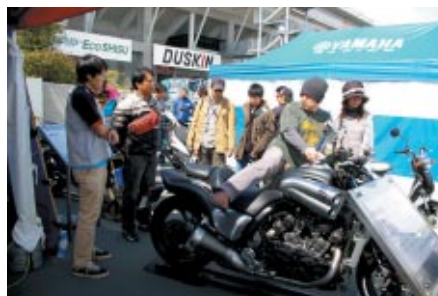
2輪ニューモデルの展示と搭乗体験が実施されたヤマハブース