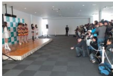
ホスピタリティラウンジバスをお持ちのお客さまを対象に行われた「レースクイーンフォトセッション」