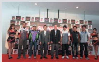
参加予定チーム・選手、そして関係者の皆さんによる記念撮影 35回目の夏、どんなドラマが生まれるのでしょうか?