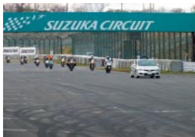
BMW Motorrad 39