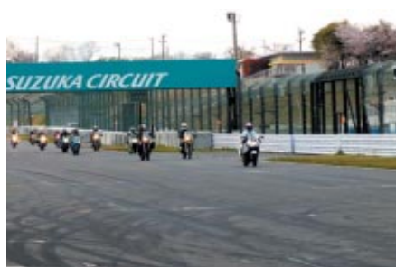
酒井大作選手が先導してのBMWオーナー限定体験走行 (主催:Motorrad 39)