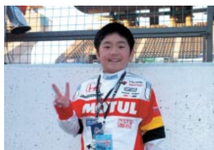
いうまでもなく山本尚貴選手の大ファンだそうです 心なしかルックスも…