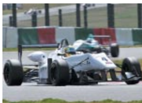
第2戦 平川 亮