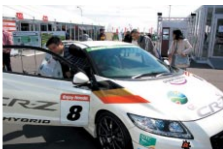
「Honda Sports & Eco Program」仕様のHonda CR-Zの展示と搭乗体験が実施されたM-TECブース