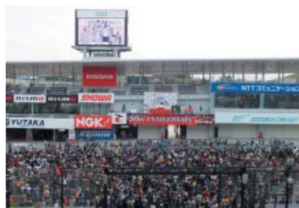
フォーミュラ・ニッポン決勝レース終了後は、ストレート上を お客さまに開放 熱戦の余韻が残るコースから上位選手を 観えていただきました