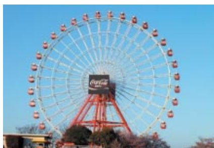
カラーリングを一新してお目見えしたおなじみの大観覧車 ネーミングも「サーキットホイール」にリニューアルされました