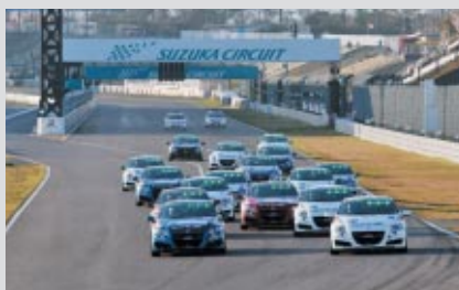
16台が出走した決勝レーススタートシーン

「Ecoでスポーツする」を合言葉にスタートした「Honda Sports & Eco Program」。今回は決められたガソリン量でエコと速さを両立させる「CR-Z 10リッターチャレンジ」が行われました。