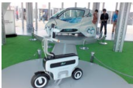
東京モーターショー2011に出展されたコンセプトモデルを展示 Hondaが描く未来のモビリティライフを感じることができました