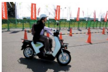
きれいで静かなエネルギー 電動バイク「Honda EV-neo」の 試乗会が行われました