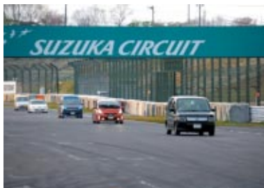
Enjoy Honda My Hondaラン