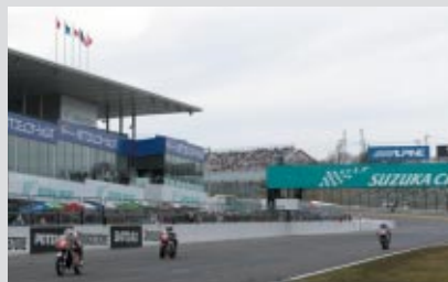
走行するマシン 左からCB500R(75)、NS500(85)、NSR500(90)