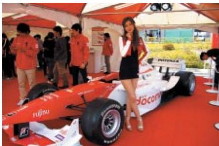
フォーミュラ・ニッポンマシンが展示されたNTTドコモブース