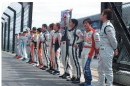
グランドスタンド前に全選手が整列して行われたフォーミュラ・ニッポンの選手紹介