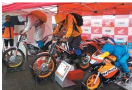
トライアルマシンやロードレーサーの展示・搭乗体験が行われたHondaブース