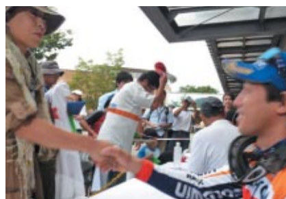
DAY1表彰式終了後に行われたトップライダーサイン会