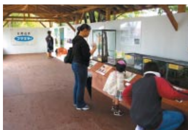
身近な外来生物などについて分かりやすく学べる 「フマキッズこども研究所 (協賛:フマキラー株式会社)」(ハローウッズ)