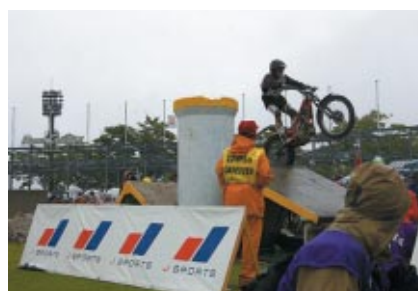
セクション1、15に設置されたJ SPORTSバナー