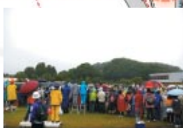
"J SPORTS" Zone J SPORTS ゾーン Sections 1 2 3 15