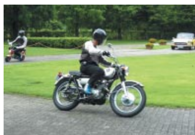
Honda Collection Hall所蔵車両のデモ走行 今回はCL72(写真)、モンキーM、S600が元氣な姿を見せてくれました