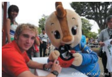
ライダーサイン会にコチラちゃんも飛び入り参加 マイケル・ブラウン選手にサインをもらってご満悦