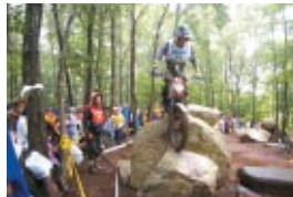
"Hello Woods Marsh" Zone ハローウッズの沢ゾーン Sections 7 8 9

今年より走行ルートが逆周りになった15のセクションを下図の通り配置し、お客さまにはハローウッズを中心としたコンパクトで歩きやすい観戦環境をお届けするとともに、ライダーには闘志をかきたてるチャレンジングなレイアウトを実現しました。