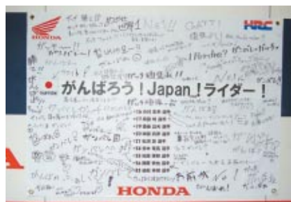
Hondaブースに設置された日本人ライダーへの応援メッセージ