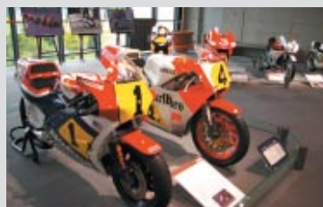
ロードレース世界GPをライバルとして戦った 日本製マシンを集めた「切磋琢磨～挑戦者たちの再会～」 (10月2日(日)まで)