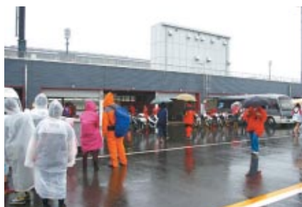
大会期間を通じて一般のお客さまに開放されたピット・パドックエリア