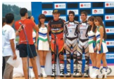
DAY1ユースクラス表彰式終了後、上位ライダーと ツインリンクもてぎエンジェルとの記念撮影が表彰台で始まってしまいました