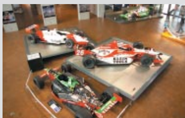
いよいよ今年で最後となるINDY JAPAN®。 ツインリンクもてぎでの戦いの歴史を紹介した 「HIGHLIGHT～アメリカントップフォーミュラが くれた興奮と感動～」(9月19日(月・祝)まで)

今秋ツインリンクもてぎで開催される2つのビッグイベント「INDY JAPAN® THE FINAL」と「MotoGP日本グランプリ」。Honda Collection Hallでは、これらにちなんだ特別展示が行われています。