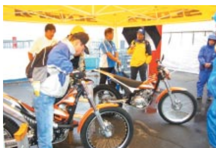
トライアルマシンが展示されたSCORPAブース