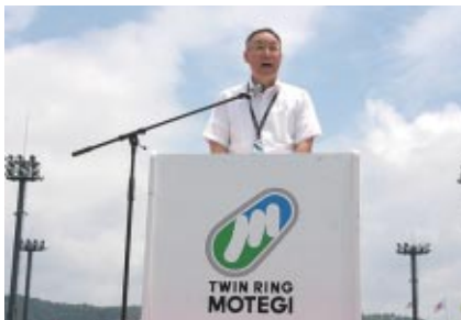
茂木町町長 古口達也様からのお祝いのご挨拶