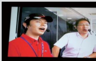
JSB1000クラスのスペシャル解説を行っていただきました