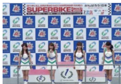
ツインリンクもてぎエンジェルのニューフェイスのお披露目がボディウムで行われました