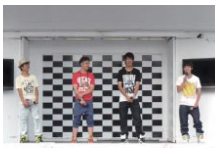
全日本ロードレースの若手ライダーによるユニット「R4」グランドスタンド特設ステージでライブパフォーマンスで会場を盛り上げました