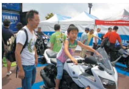
ニューモデルの搭乗体験が行われたYAMAHAブース