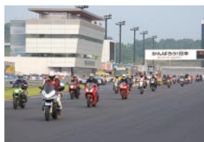
全レース終了後バイクでご来場のお客さま限定で行われる恒例のイベント「フィナーレパレード」