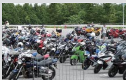
Honda Collection Hall前に設けられた専用駐車場 ライダーたちの笑顔と歓声であふれていました