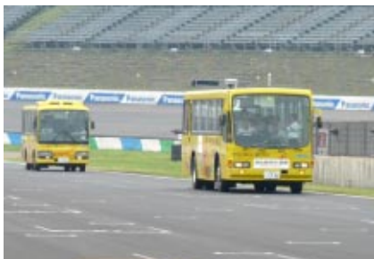
先着120名様にお楽しみいただいた「ロードコースバスツアー体験」