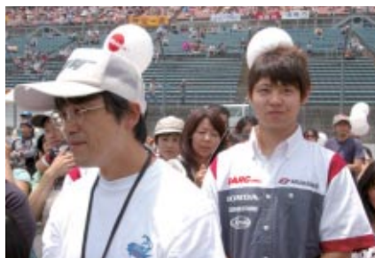
「がんばろう! 日本」の人工字の中にさりげなく…高橋巧選手!