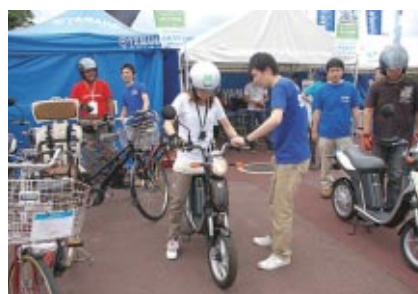
YAMAHAブースで行われた電動バイク「EC-03」と電動アシスト自転車「PAS」試乗会