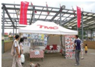
東京モータースポーツカレッジ