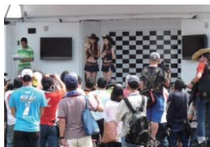
グランドスタンドプラザ特設ステージで行われたキャンギャルオンステージ