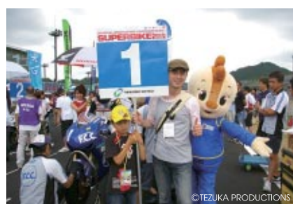
グリッド上のJSB 1000マシンをエスコートしていただく人気のイベント「グリッドキッズ」