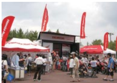
株式会社ホンダモーターサイクルジャパン