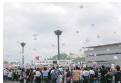
ツインリンクもてぎ復活を祝してセレモニーの最後には多くの風船が上空に放たれました