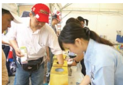
すべてのご来場者を対象に総額300万円相当の賞品が当たる大抽選会が実施されました