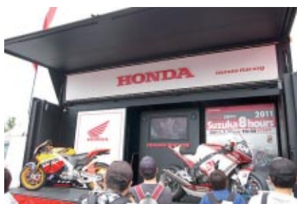
MotoGPマシンや8耐優勝マシンが展示されたHondaブース