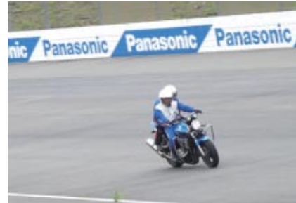
スーパースピードウェイでASTPインストラクターの運転するビッグバイクのタンデム体験をお楽しみいただきました