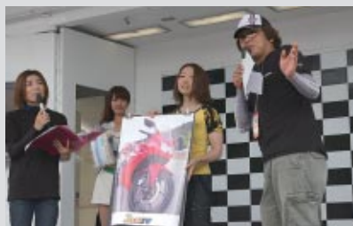
さまざま角度からお客さまを表彰 写真はカスタムマシンの表彰風景