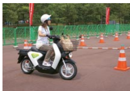
Hondaブースで行われた新時代の電動バイク「EV-neo」試乗会