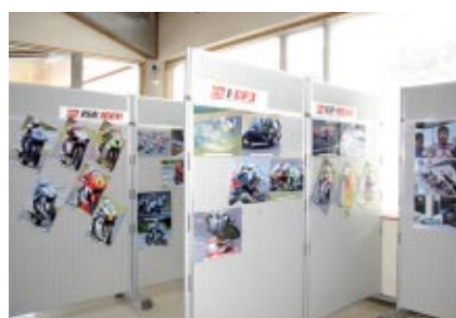
ツインリンクもてぎにほど近い「道の駅もてぎ もてぎプラザ」で 行われているロードレース写真展(7月17日(日)まで)