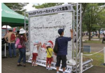
MotoGPライダーたちへの寄せ書きボードがグランドスタンドに 設置され、あっという間に熱いメッセージで埋めつくされました