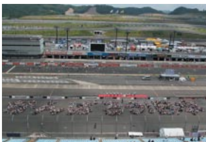
お客様・関係者が一体となってつくった「がんばろう! 日本」の人文字