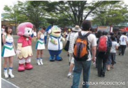
ゲートオープン時にはコチラレーシング、ツインリンクもてぎエンジェル、さらにスタッフが勢ぞろいしてお客さまをお迎えました

7月2日(土)は「元気と笑顔の復活デー」として無料開放し、記念セレモニーや各種企画などを実施しました。