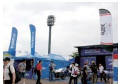
ヤマハ発動機株式会社