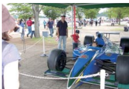
グランドスタンドプラザのコチラレーシングブースで行われたコックピット体験