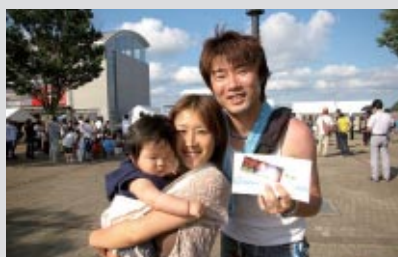
抽選会で「花火の祭典(8月14日(日))」の招待券をゲットした ご家族連れのお客さまは小山市から