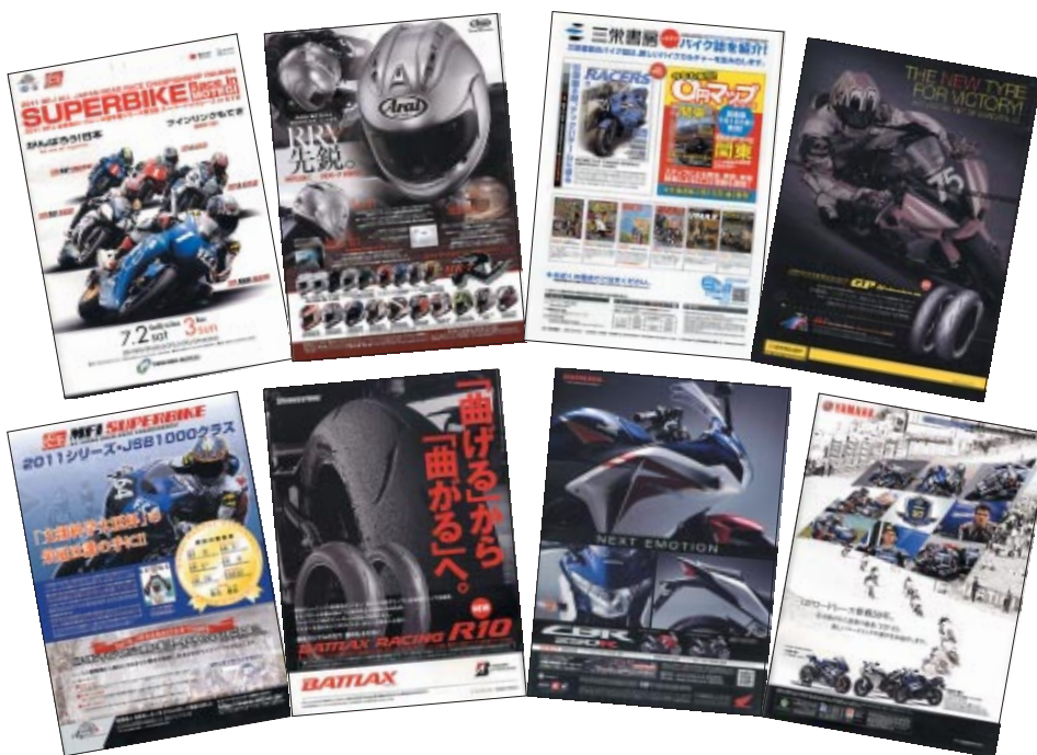
株式会社アライヘルメット