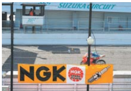
グラウンドスタンド観客席に向けて掲出されたNGK幕