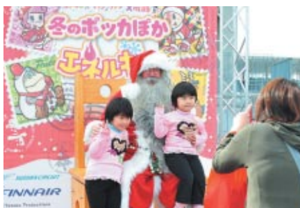
サンタの国、フィンランドからやってきたサンタクロースと記念撮影(協力:フィンランド航空)

クリスマスムードあふれる鈴鹿サーキット園内 この週末もさまざまなイベントが目白押しでした。