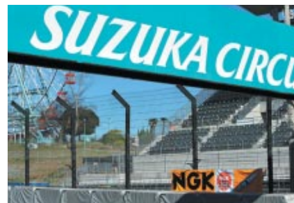
左写真の反対側、コースに向けて掲出されたNGK幕