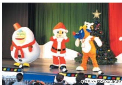
コチラファミリーの楽しいステージ