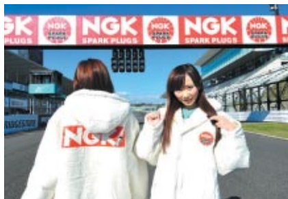
NGKコスチュームの鈴鹿サーキットクイーン 真っ青な秋空の下、大会に華を添えてくれました