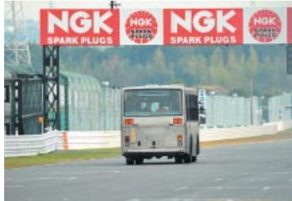
走行開始前に運行された「コース下見バス」 経験の浅い選手には義務付けとなっています