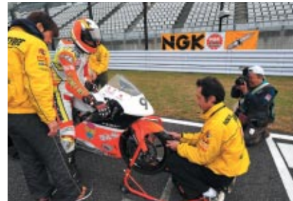
ポールポジションの真横に位置するNGK幕