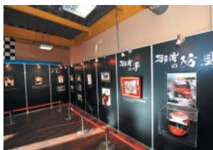
F1ドライバー 小林可夢偉選手の足跡を貴重な展示品でたどる 「可夢偉伝」