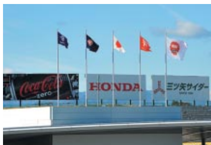
コントロールタワーに掲出された日本特殊陶業株式会社様の 社旗(左)とNGKロゴ入りフラッグ(右)