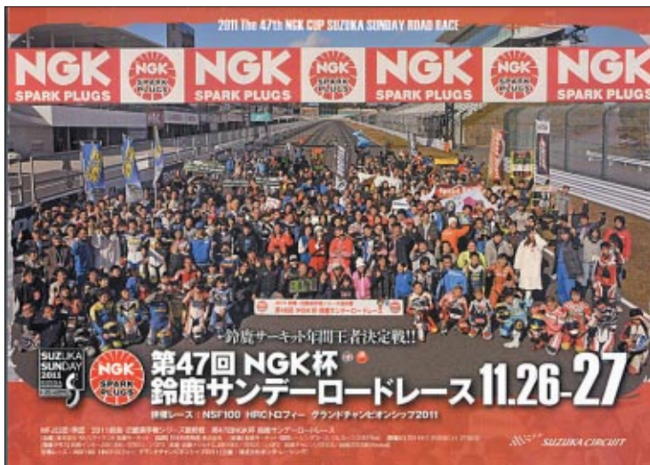
公式B3ポスター(待ち)