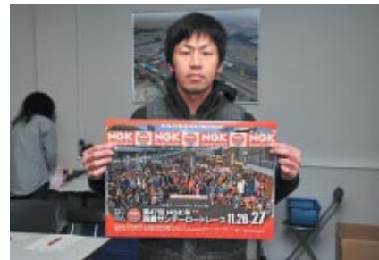
さらに選手受付では公式ポスターも配布されました