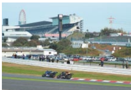
2 コーナーイン側(写真)とS字コーナーのコースサイドを 観戦エリアとして開放した「激感エリア」 観戦ポイントとして だけではなく、他の選手の走りをじっくり研究できます