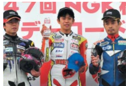
各クラス上位3選手にはNGKキャップが贈られました