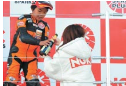
NGKコスチュームで表彰式をお手伝いさせていただきました 鈴鹿サーキットクイーン