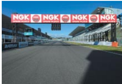
ホームストレート上のNGKロゴ入りブリッジ看板 鈴鹿サンデーロードレースのフィナーレを飾る光景です

冠スポンサーとして大会を支えていただいている日本特殊陶業株式会社様。 今年も鮮やかな赤色のロゴが週末の鈴鹿サーキットを彩りました。