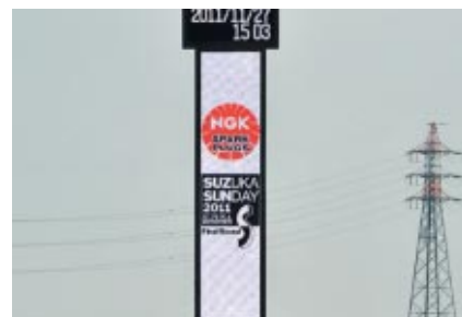
リーダータワーに表示されたNGKロゴ