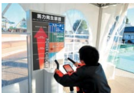
どれだけのエネルギーを発生させられるかチャレンジ! 「馬力発生装置」