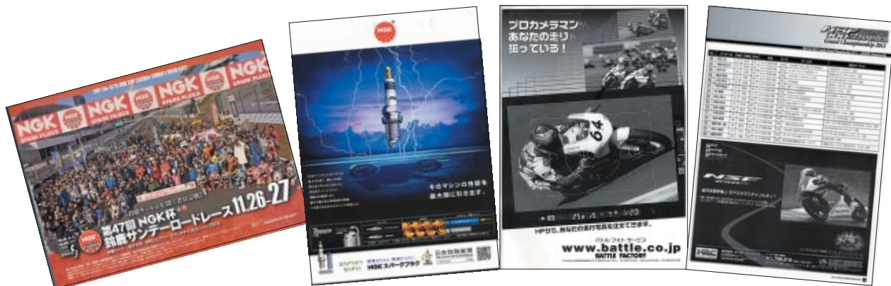
A4 カラー/モノクロ 18p