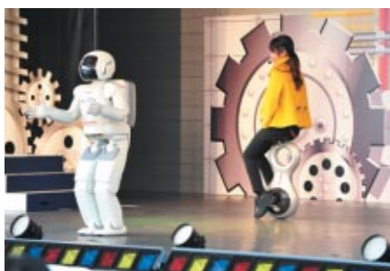
おなじみのASIMOと新世代モビリティ「U3-X」のライブステージ