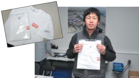
参加者全員に配布されたNGKロゴ入りTシャツ