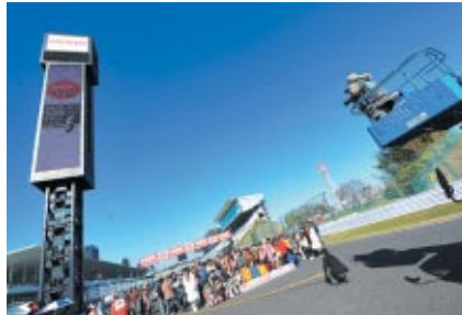
恒例の集合写真はこんな感じで撮影されています