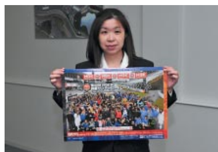
選手受付会場で公式B3ポスターを無料配布