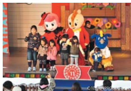
12月生まれのお友だちとコチラファミリーが楽しいひととき「コチラのハッピーハッピーバースデーパーティー」