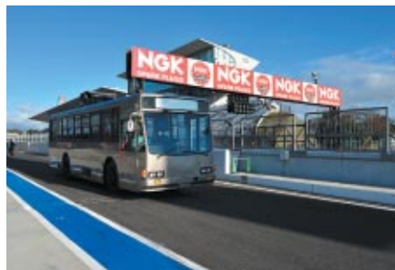
走行開始前に運行された「コース下見バス」 (経験の浅い選手は義務付け)