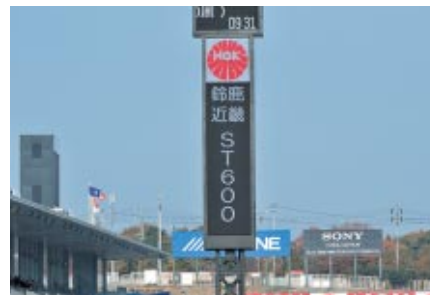
リーダータワーへのロゴ表示 注目度は抜群