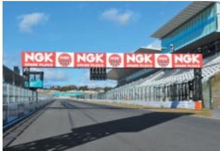
ホームストレート上のNGKブリッジ(両面) NGK杯を象徴する風景といえます

冠スポンサーとして本大会を支えていただいている 日本特殊陶業株式会社様の展開を中心にご紹介いたします。