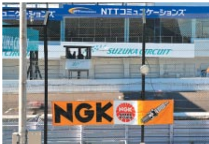
グランドスタンド側に向けて掲出されたNGK幕