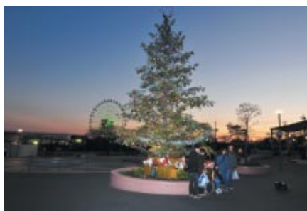
メインゲートにあしらわれたクリスマスツリー

遊園地エリアではクリスマスイベント「コチラのファンファンX'mas」を12月26日(日)まで開催中です。