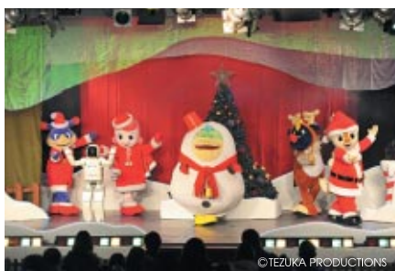
コチラファミリーとASIMOが繰り広げるダンスと音楽のファンタジックなショー「雪だるまのクリスマス」(モビステージ)