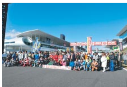
恒例の集合写真 NGKブリッジをバックに笑顔がいっぱいでした