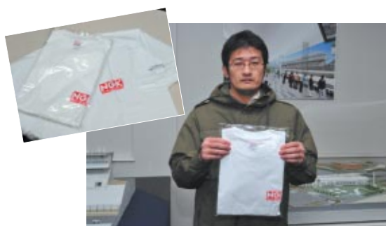
参加者全員に配布されたNGKロゴ入りTシャツ