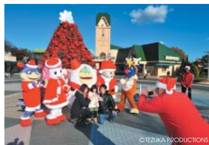
ジョイフル広場でコチラファミリーとの撮影タイム