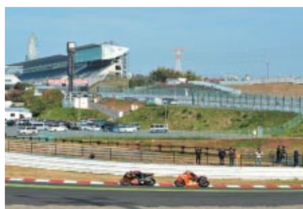
2コーナーイン側(写真)とS字コーナーのコースサイドを 観戦エリアとして開放した「激感エリア」 他の選手の走りをじっくりと観ることができ、好評でした