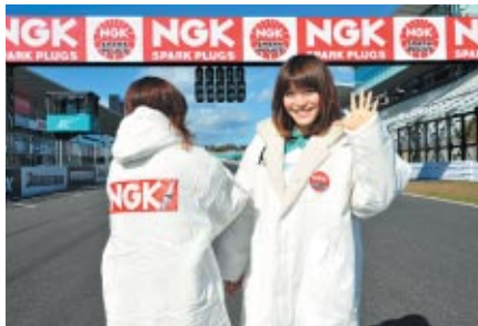
NGKコスチュームをまとった鈴鹿サーキットクイーン 笑顔いっぱいにご挨拶してくれました