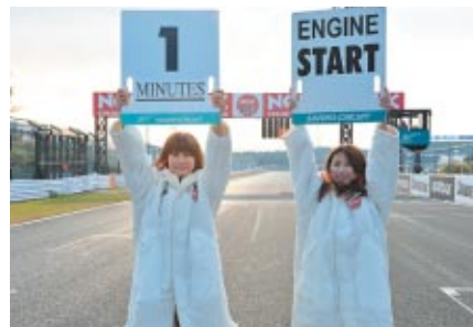
NGKコスチュームでスタート進行をお手伝いいただいた 鈴鹿サーキットクイーン