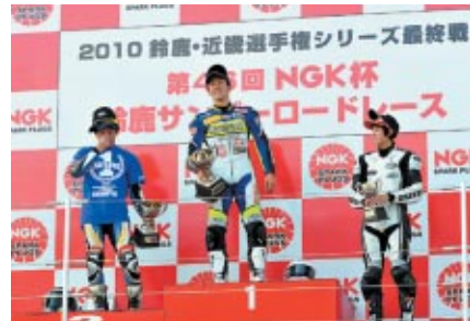
各クラス上位3選手にはNGKロゴ入りキャップと副賞を贈呈