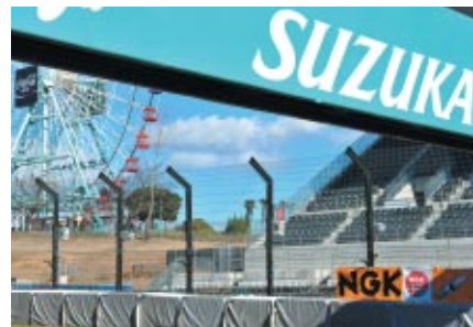
左写真の幕の反対側 コース側に向けて掲出されたNGK幕