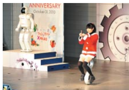
Hondaの新世代モビリティU-3Xのデモンストレーション