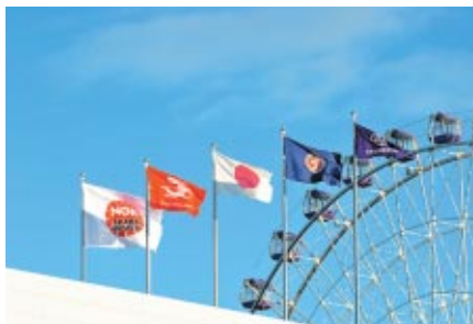
コントロールタワー上に掲出された日本特殊陶業株式会社様の 社旗(右)とNGKロゴ入りフラッグ旗(左)