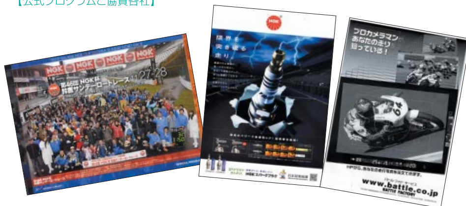
公式プログラム A4 カラー/モノクロ 18p