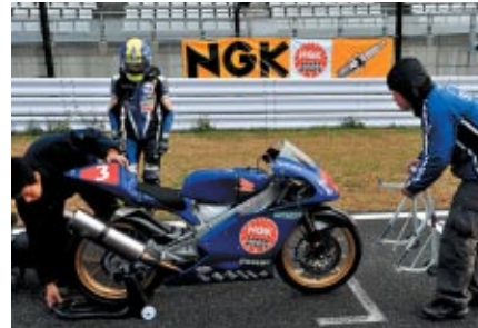
ポールポジションを称えるかのように グランドスタンドフェンスに掲出されたNGK幕