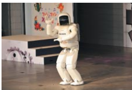
今年誕生10周年を迎えたASIMOが軽快なダンスを披露(モビステージ)