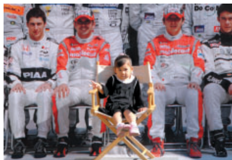
未来のフォーミュラ・ニッポンドライバーよ!