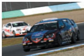
インテグラ 酒井 とくしげ