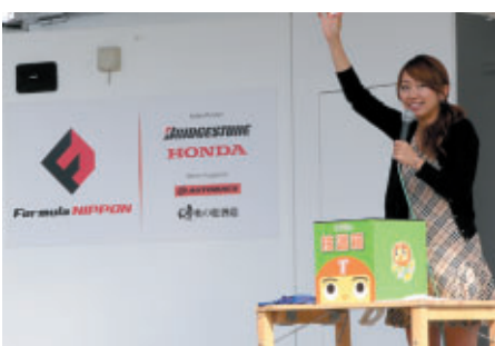
とちぎTVの大抽選会 今回は、ピットウォークバスが当たり