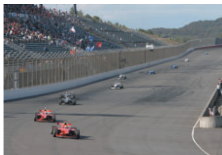
決勝レース前にはスーパースピードウェイ上で高速パレードランが行われました