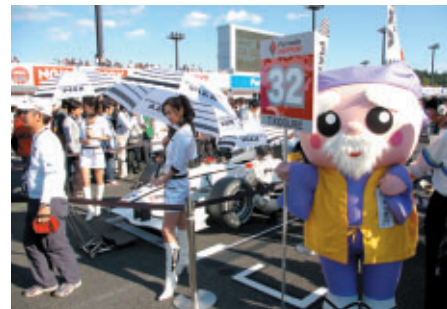
11月に開催される「国民文化祭いばらき2008」からハッスル黄門と高校生サポーターがグリッドクルーとして参加しました