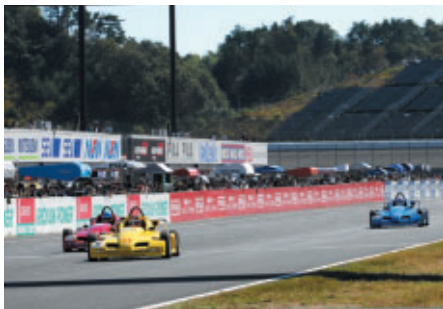
21日(日) ピットウォーク中に賞品のメロンをかけて熱いバトルが繰り広げられた 【いばらきメロンカップ マスター・オブ・フォーミュラ】