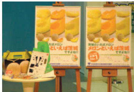
ファンファンラボでは生産量日本一のメロンの展示PRのほか、「ASIMOと遊ぼう!」では、メロンやハッスル黄門のストラップが来場者にプレゼントされました