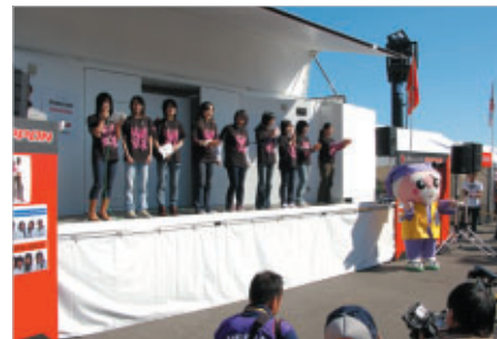
フォーミュラ・ニッポンステージでも第23回 国民文化祭・いばらき2008のPR高校生サポーターが大活躍!