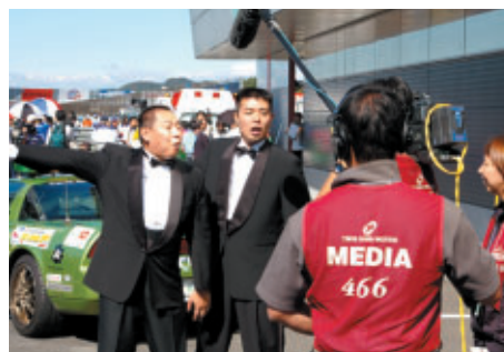
21日(日)の決勝前ピットウォークではTVでおなじみのお笑い芸人レギュラーも登場?!