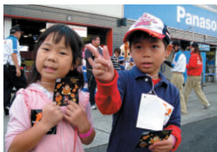
20日(土)のKIDSピットウォークに参加したお子様にはオリジナルステッカーをプレゼント