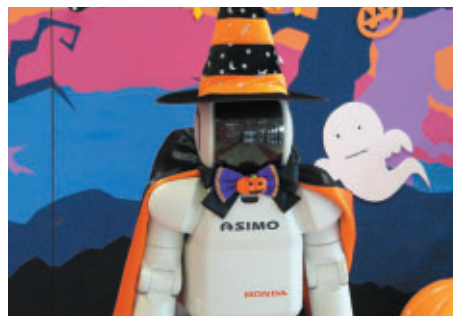
場内では、ハロウィーンの雰囲気 が所々に ASIMOも仮装中!