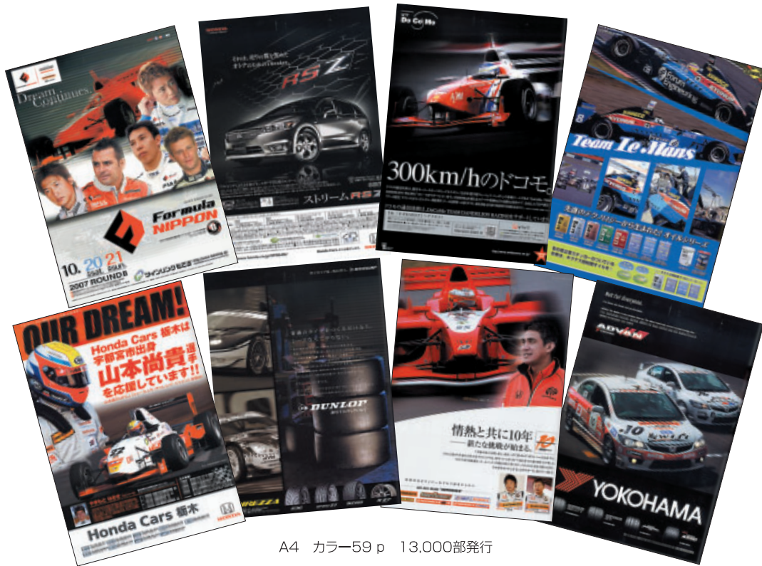
A4 カラー59 p 13,000部発行

株式会社 アライヘルメット 株式会社 アイデア 株式会社 エヌ・ティ・ティ・ドコモ 株式会社 オートバックスセブン キグナス石油 株式会社 株式会社 三栄書房