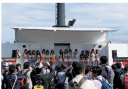
フォーミュラ・ニッポンステージに 参戦しているチームのキャンギャルが勢揃い