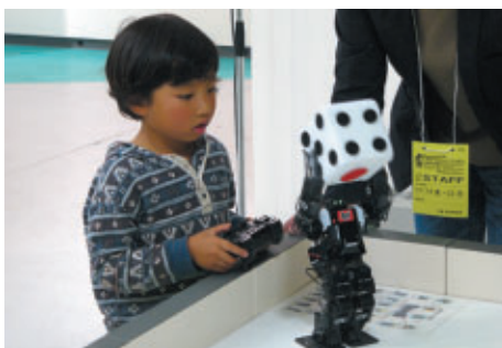
期間中、ファンファンラボで行われたロボットワールドではロボット操作体験ができるなど家族みんなで楽しめました