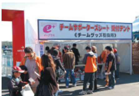
チームサポーターズシート受付テントでチーム応援グッズを もらって、さあ応援!