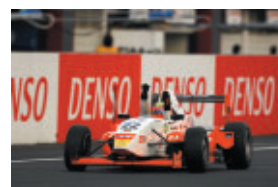
FCJ 第15戦 山本 尚貴