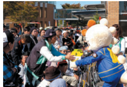
ツインリンクもてぎエンジェルとこちらレーシングによるイベントPR後に行われたジャンケン大会では、豪華メロンをプレゼント!