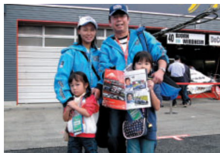
ピットウォークを楽しんでいらっしゃったお客様プログラムには選手のサインがたくさん!