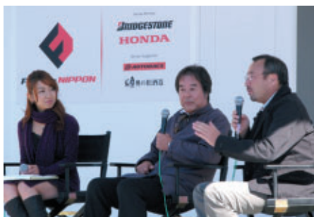
21日(日)に行われた監督トークライブに参加した 星野一義監督(mobilecast TEAM IMPUL)