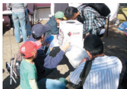
Honda Fitが当たる「順位当てクイズ」 ビックチャンスも残り2戦となり、がぜん力が入ります!