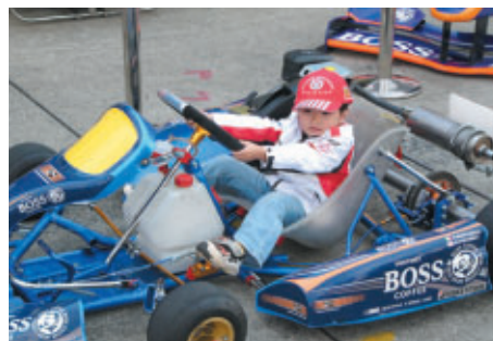
まだ足が届かないけどボクもドライバーだ!