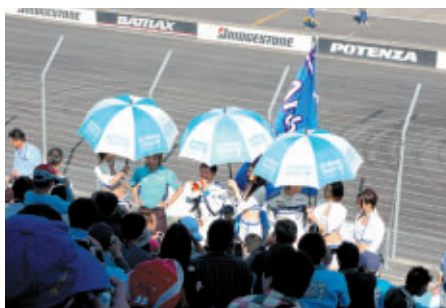
オープニングセレモニー前にはドライバーがサポーターズシートでファンサービスを実施しました