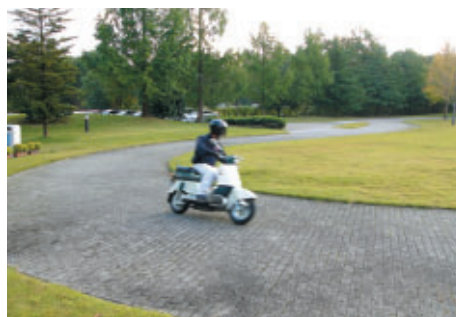
Honda Collection Hallで行われる週末恒例のウィークエンドランではジュノM85(1964年)がデモ走行