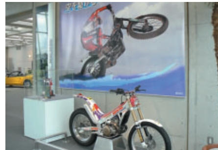
「空を駆ける～華麗なるテクニック、トライアルの世界～」と題された特別展示(Honda Collection Hall)トライアルの歴史や歴代の名車を解説・展示