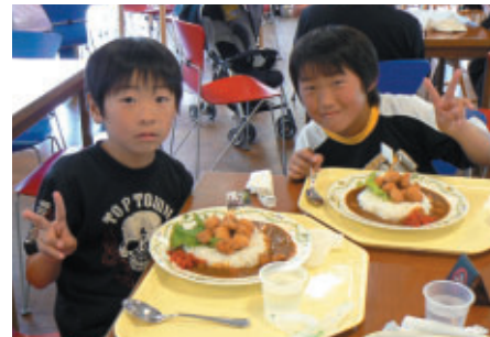
「フジガス勝つかレー」を親子4人でお召上がり 「埼玉から来ました 今日道の駅で泊まります」