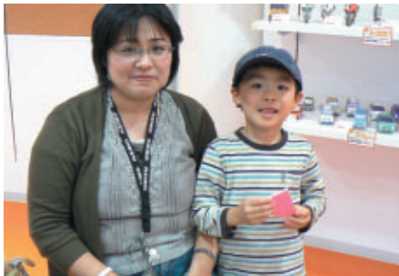
ファンファンラボでお会いした新潟からお越しの親子連れ 「お父さんは？」との問いかけに「一人で観戦してます」