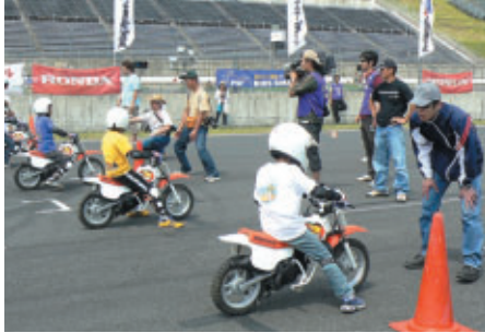
Honda QR50を用いたMFJキッズバイクスクール(3日)