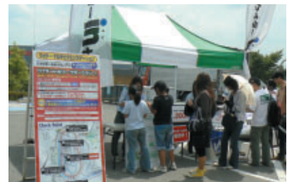
ウイダーマルチビタミンステーション