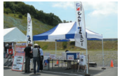
ウイダープロテインステーション