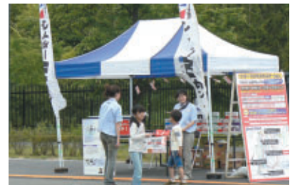
ウイダーマルチミネラルステーション