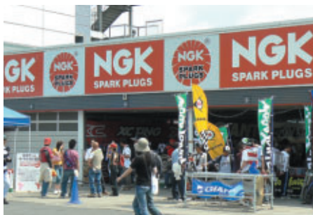
ビットがトライアルショップに変身した週末でした