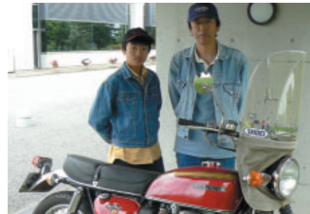
5年がかりでレストアしたCB750F Four K4で県内から お父さんは昔トライアルをやっていたそうです