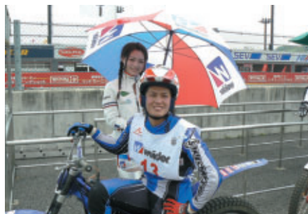
ウイダーガールが全選手を笑顔でサポート