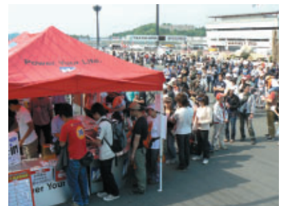
多くのお客様が参加されました