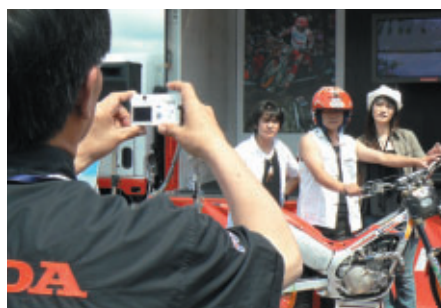
モンテッサワークスマシンと藤波ヘルメットで「FUJIGASなりきり!」(Hondaブース)