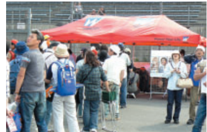
ウイダーエネルギーステーション