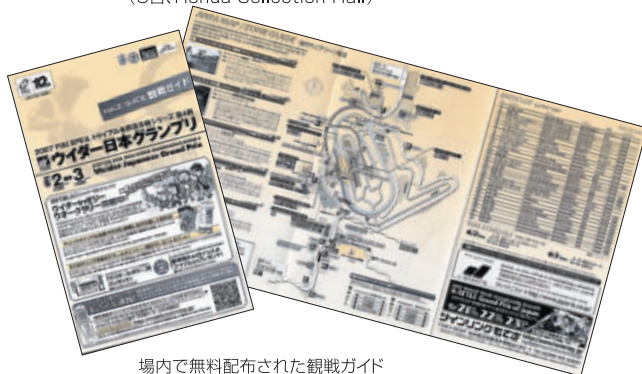
場内で無料配布された観戦ガイド