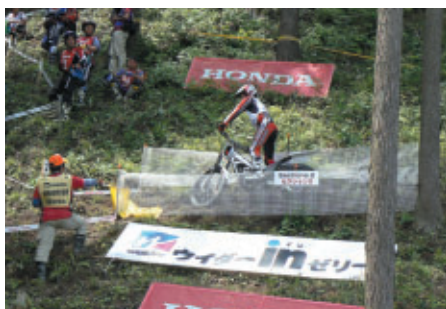
全セクションで掲出されたウイダーとHondaバナー