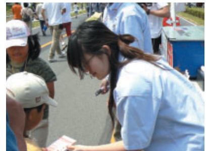
各ステーションでスコアカードにチェックを入れます