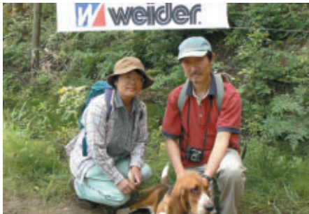
茨城から愛犬とともにご来場 「昨年以外は2000年の初開催からすべて観戦に来ました」