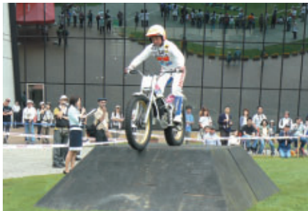
往年の名マシンがよみがえる「Hondaトライアルサウンド」(3日、Honda Collection Hall)