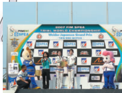
各日、競技終了後に行われた抽選会