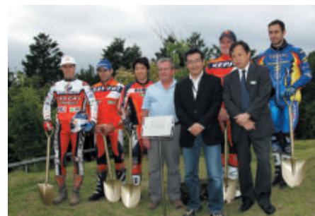
6月は環境省が定める「環境月間」、また大会直後の 6月5日(火)は「世界環境デー」にあたり、その一環行事として トップライダー5人がツインリンクもてぎ内に植樹を行いました(1日)