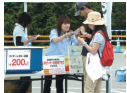
各ステーションではウイダーinゼリーの販売も行われました