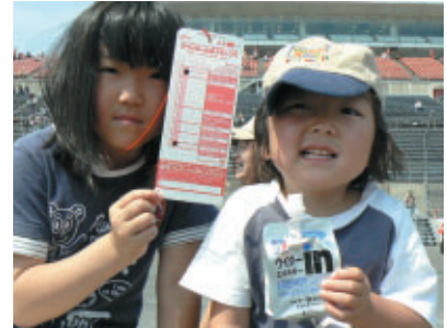
このスコアカードでチャレンジ!