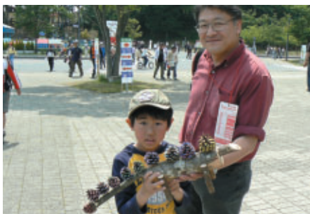
ハローウッズ「森のクラフト教室」での作品を手に 「観戦前にランチします」と横浜からの親子連れ