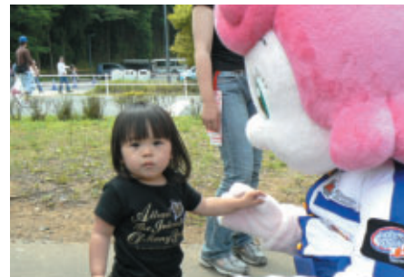
もてぎでもすっかりおなじみになったコチラレーシング