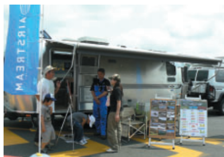
アメリカ製高級キャンピングカー「エアストリーム サファリFB」をロードコース上に展示 豪華な車内もご覧いただきました