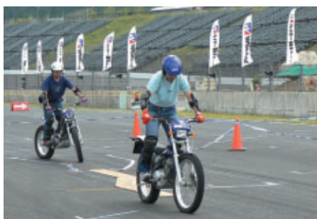
ヤマハトライアルマシン体験試乗