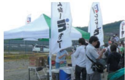
ウイダーファイバーステーション