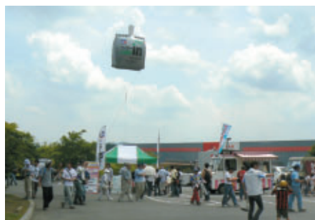
恒例のウイダーバルーン 今年はスーパースピードウェイに加えて「ハローウッズの森」ゾーンにもお目見え