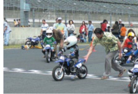
ヤマハPW50を用いたMFJキッズバイクスクール(3日)