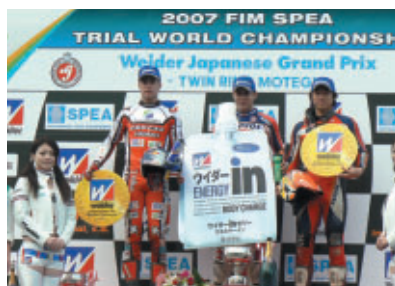
1日目表彰台 T・ボウが今季5連勝