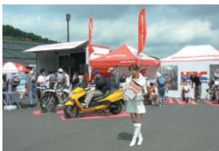
Honda市販車やHRCLレーシングマシンを展示(ロードコース上)