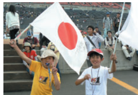
長野からご両親と 「来年はFUJIGASが絶対勝つ！」