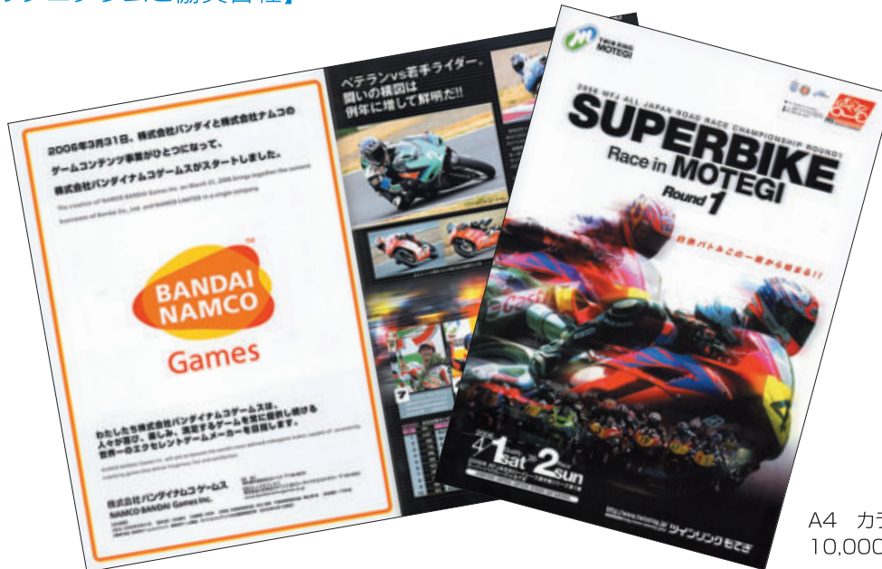
A4 カラー44p 10,000部発行

株式会社 アライヘルメット 株式会社 アールケー・エキセル GAORA 株式会社 カワサキモータースジャパン 株式会社 鈴鹿サーキットランド スズキ 株式会社 ダイドードリンコ 株式会社 ダンロップファルケンタイヤ 株式会社 日本テレビ放送網 株式会社