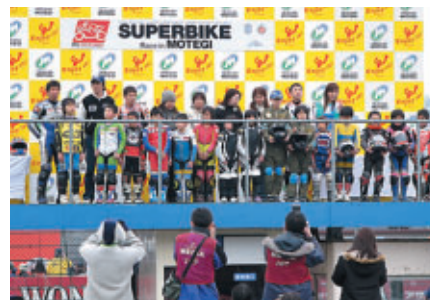
ライダー養成システム「MFJロードレースアカデミー」のお披露目