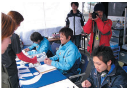
ライダーサイン会(アライ)