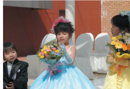
気の早い花嫁・花婿さん (ホテルツインリンク・チャペル)