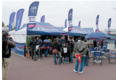
本田技研工業 株式会社 株式会社 ホンダモーターサイクルジャパン