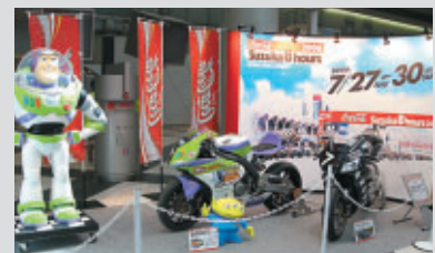
トイストーリーレーシングなど話題も豊富