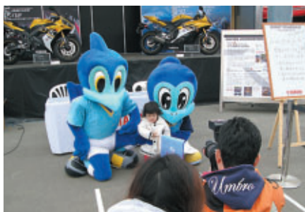
ジュビロ磐田のキャラクターも登場(ヤマハ)