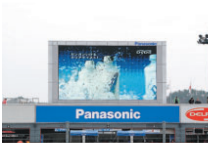
GAORA 株式会社 鈴鹿サーキットランド