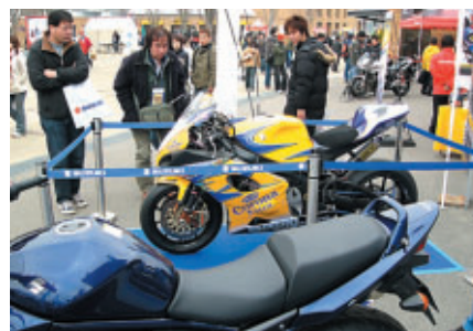
レーシングマシンに注目(スズキ)