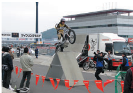
ピットウォーク中に行なわれたHondaトライアルバイクショー