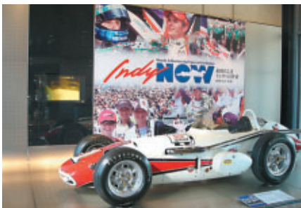
20日(木)に開幕するインディの歴史と魅力を (コレクションホール)