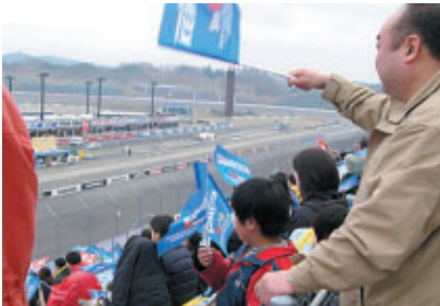
株式会社 ケーヒン