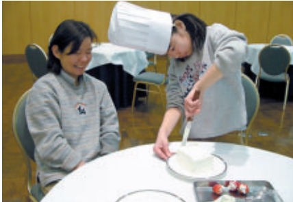
パティシエに挑戦! (ホテルツインリンク)

ツインリンクもてぎでは、春のファミリーカーニバル「夢・体験」を開催。本週末はその最終日となり、レース観戦客のみならず多くのファミリー客の笑顔にあふれていました。