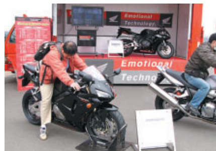
ニューモデル搭乗(ホンダ)