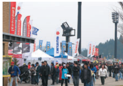
グランドスタンドプラザ