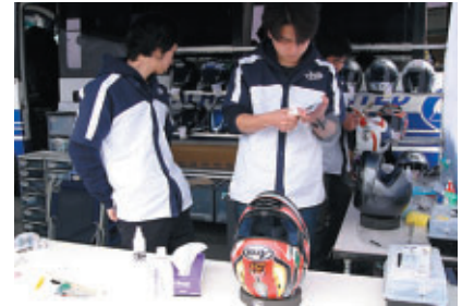
ヤマハ発動機 株式会社