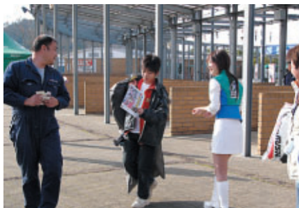
ツインリンクもてぎエンジェルのお出迎え