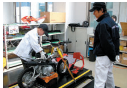
コレクションホールではメカニック体験も