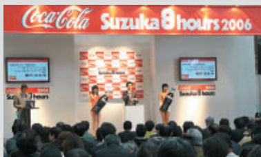
約85媒体270名様が出席

3月31日(金)、東京モーターサイクルショー(当日来場者数:15,020人)の行なわれている東京ビッグサイトにて”コカ・コーラ” 鈴鹿8時間耐久ロードレース第29回大会の記者発表が行なわれました。7月30日(日)の決勝に向けて、今年も大きな注目が集まりそうです。