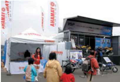
株式会社 アライヘルメット スズキ 株式会社