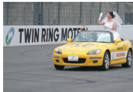
スーパースピードウェイをパレード