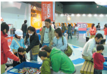
トミカフェア (ファンファンラボ)