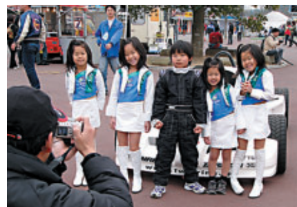
レーサーやツインリンクもてぎエンジェルになれる!