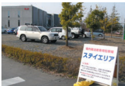
場内宿泊にはステイエリアをどうぞ