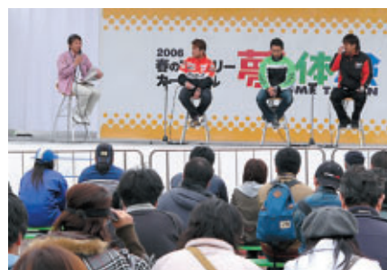
ライダートークショー