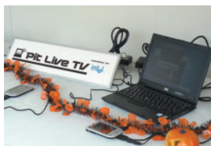
そしてPit Live TVブースでも…

PICK UP 地元・とちぎテレビとのタイアップにより、視聴者から抽選で10組の幸運なファミリーに「パドックツアー」をプレゼント。PIAA NAKAJIMAピットやブリヂストンガレージを訪ねて、貴重な体験をお楽しみいただきました。