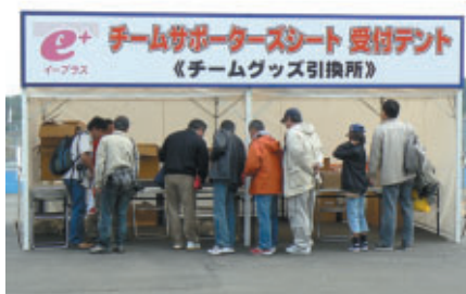
グランドスタンドプラザに設けられた受付ブース

■おなじみとなった「チームサポーターズシート」。今回も応援グッズプレゼントやドライバーの訪問など、サプライズに満ちていました