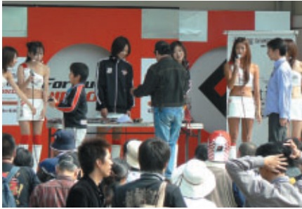
抽選で賞品をゲット! アーティンングレースクーンの「ちょっとだけhappiness」

■ イベント会場のメインとなる「フォーミュラ・ニッポンステージ」では、 今回も数多くのイベントが開催されました。