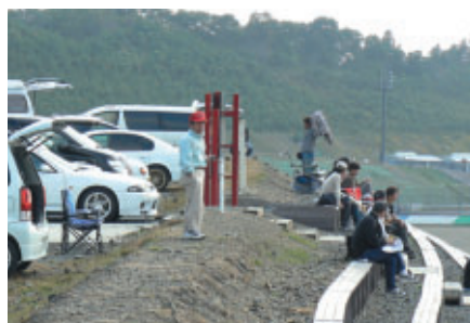
クルマから降りればそこが観戦席「コースサイドパーキング」