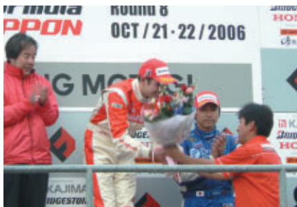
さらにサポーター代表から花束がB、トレイルイ選手に贈呈されました