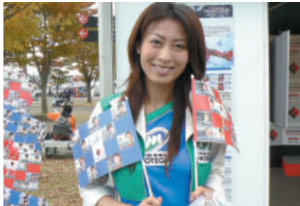
無料で配布されたエンジンユーザー別応援フラッグ