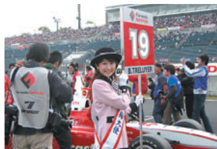
フロントローのグリッドガールは水戸市の「梅大使」のお二人につとめていただきました