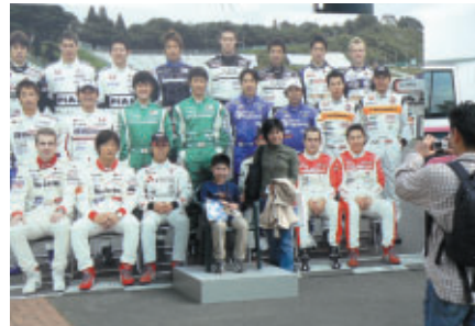
選手たちといっしょに記念写真? すごくリアルなパネルです