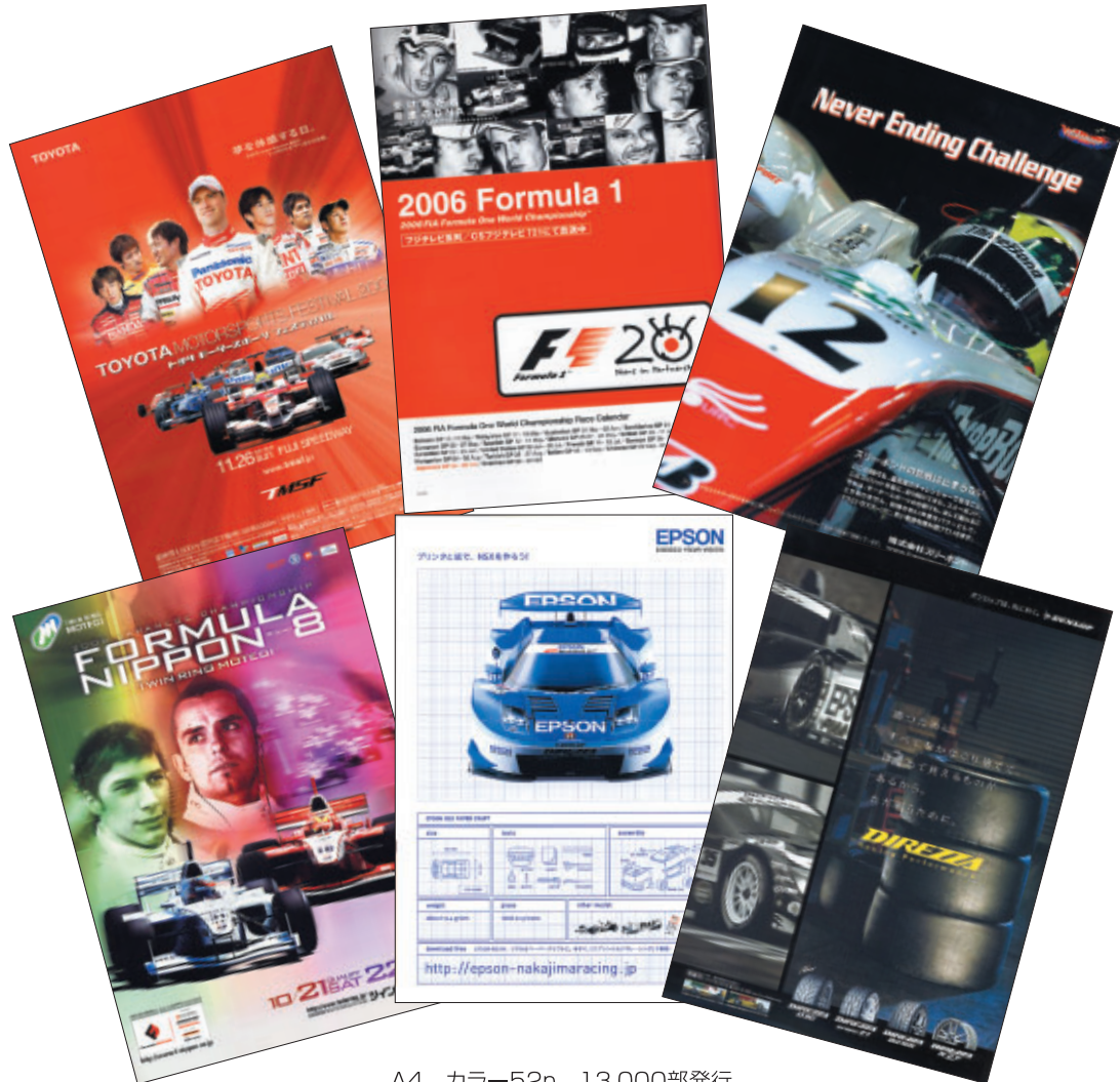
A4 カラー52p 13,000部発行

株式会社 アーテイング 株式会社 アライヘルメット エプソン販売 株式会社 株式会社 オートボックスセブン 鹿島建設 株式会社 株式会社 スリーポンド