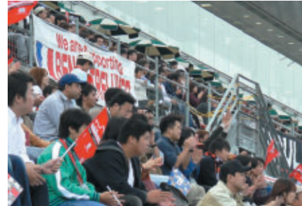
mobilecast TEAM IMPULシート