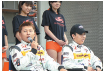
ARTAブースで行われた金石・小暮選手トークショー