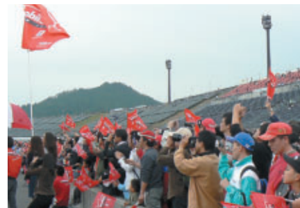
mobilecast TEAM IMPULサポーターは表彰台最前列から祝福