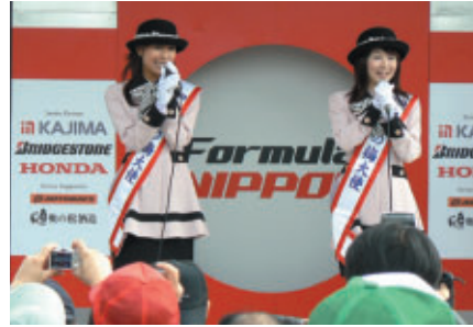
水戸市の観光大使「梅大使」のお二人によるPRタイム