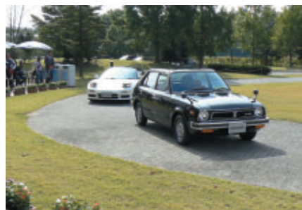
Honda Collection Hall所蔵マシンの公開走行 「ウィークエンドラン」では、初代シビックとNSX-Rがランデブー走行