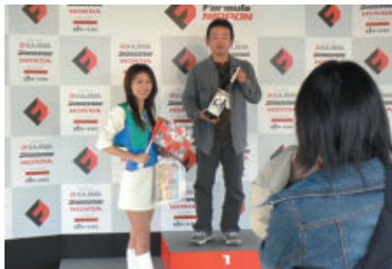
ウィナー気分が味わえる表彰台体験コーナー