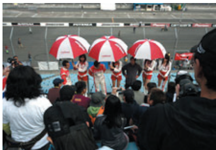
ドライバーやチームギャルがシートを訪問