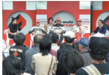
F3の上位入賞者に聞く「F3 ウィナーズ アピアランス」