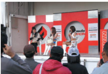
ウラ話満載? チームギャル座談会