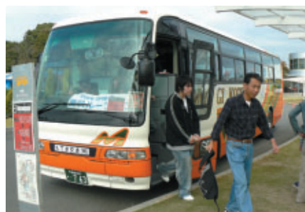
広い場内も無料ループバスでラクラク移動