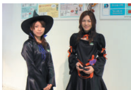
ハロウィンシーズン ファンファンラボのスタッフも ごらんのコスチュームです