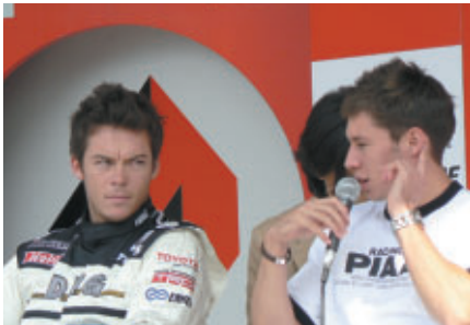
デュバル選手とA.ロッテラー選手が 決勝へ向けての豊富を語りました