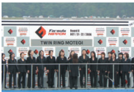
宇都宮市を中心に活動するゴスペルユニット Brown Blessed Voiceの皆さんによる国歌斉唱