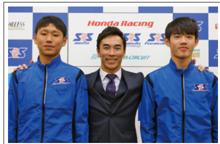
HRS-Kartアドバンス第1期受講生

HRS鈴鹿 Kartクラス ベーシックコースの成績優秀者から選抜した受講生に受講資格が与えられます。