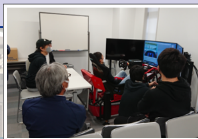
シミュレーター訓練風景