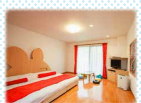
●West館 コチラ ファミリールーム イメージ