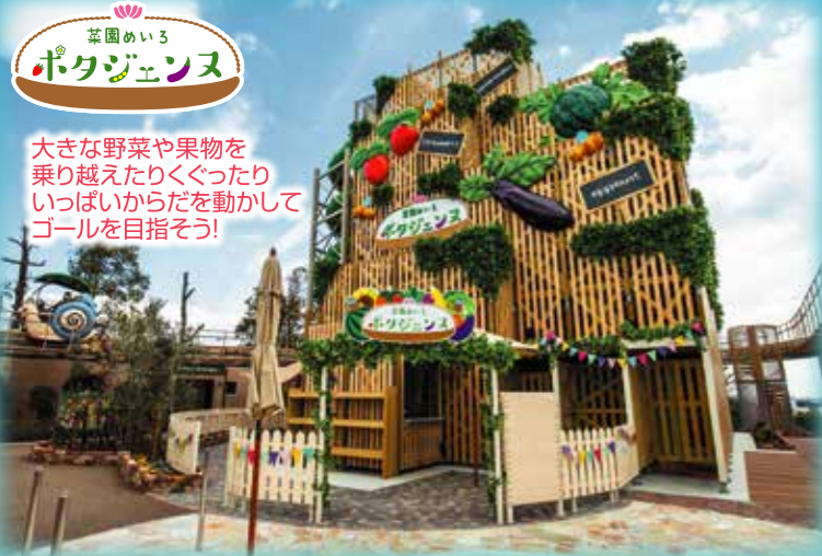
茶園めいる ポタジェンヌ

大きな野菜や果物を 乗り越えたりくぐったり いっぱいからだを動かして ゴールを目指そう!