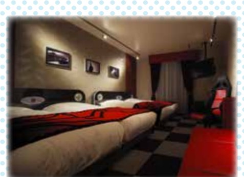
●North館 レーシングルーム イメージ